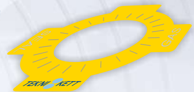
Etiketter med komplexa former.