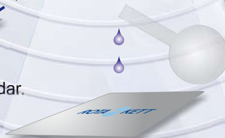
Etiketter för tuffa miljöer.