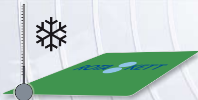
Etiketter för applicering i låga temperaturer