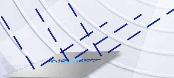
Etiketter som skyddar.