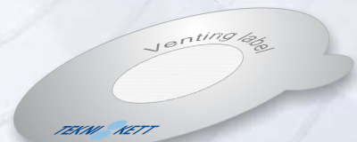
Ventilerande eller filtrerande etiketter.