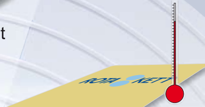
Etiketter för höga temperaturer. Upp till 500°C