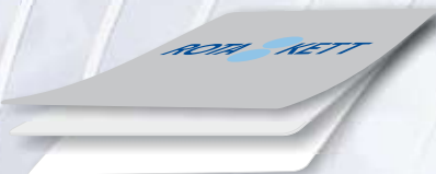
Skräddarsydda materialkombinationer i flera skikt.